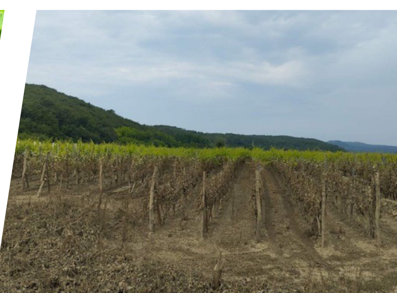
Vrbnik - vinograd nakon povlačenja vode