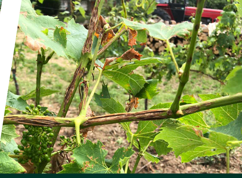
Štete od tuče