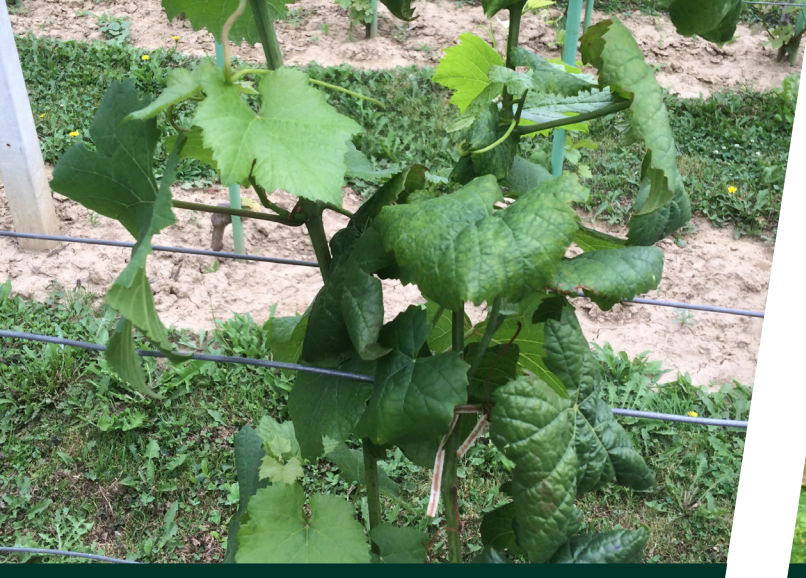
Fitoplazma na mladom trsu

U vinogradima u kojima još nije prskano protiv sive plijesni potrebno je dodati Teldor ® 1,5 l/ha. U nekoliko vinogorja padala je tuča koja je oštetila vinograde nejednakog inzenziteta. Oštećene vinograde od tuče prvo oprskati aminokiselinama pa napraviti zaštitu pesticidima. Zadnjih nekoliko dana mogu se vidjeti simptomi fitoplazme i ESC-e. Zaražene trsove odrezati 20 - 30 cm iznad tla i ranu premazati zaštitnom pastom ili kremom. Što prije oštucati vinograde pa će zaštita vinograda biti olakšana.