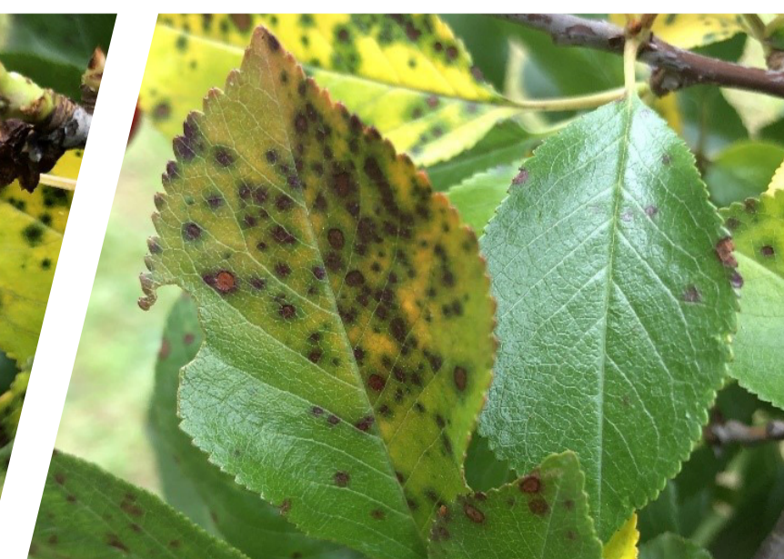
Kozičavost na trešnji